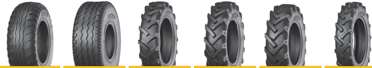
KNK42 KNK48 KNK50 KNK52 KNK54 KNK140