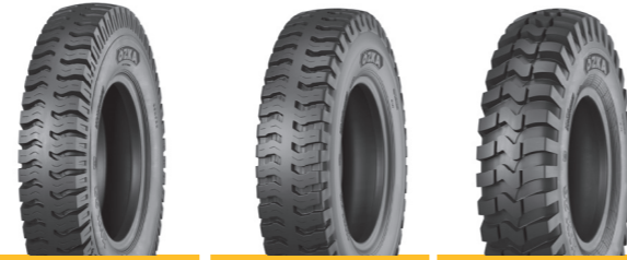
KNK22 KNK25 KNK26