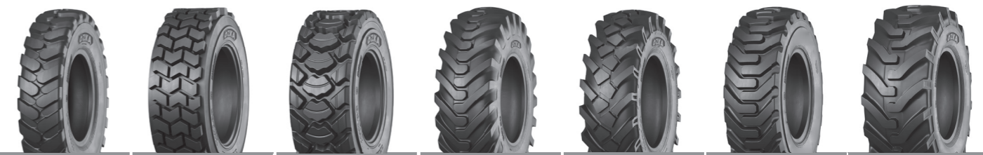
KNK44 KNK65 KNK66 IND80 KNK12 IND85 IND88