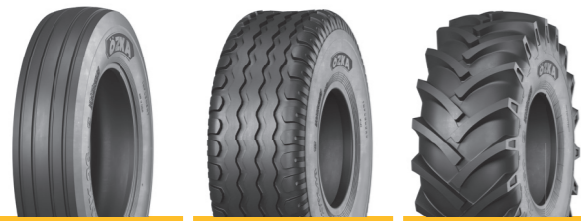
KNK36 KNK48 KNK50