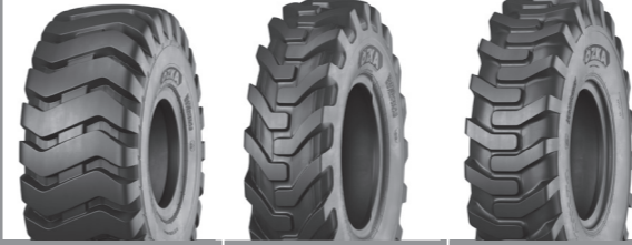
KNK70 KNK72 KNK74