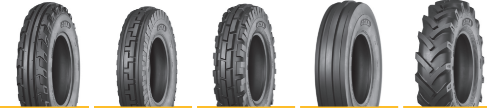
KNK30 KNK32 KNK33 KNK35 KNK50