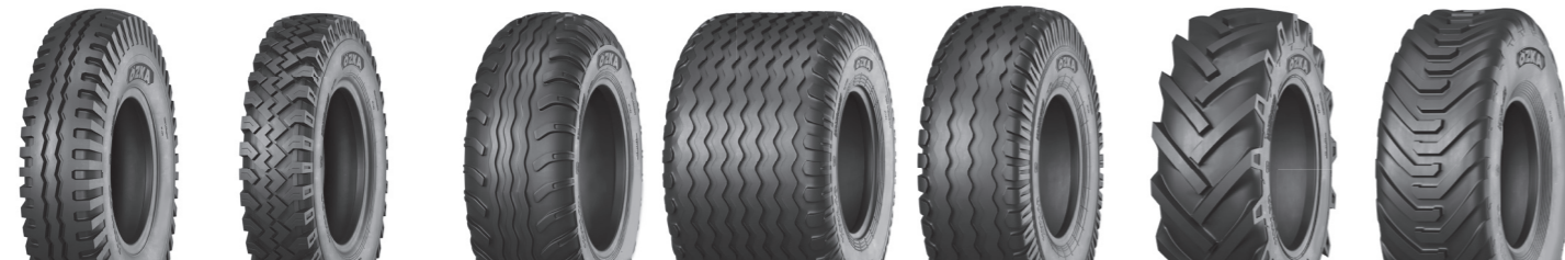
KNK27 KNK28 KNK42 KNK46 KNK48 KNK52 KNK56